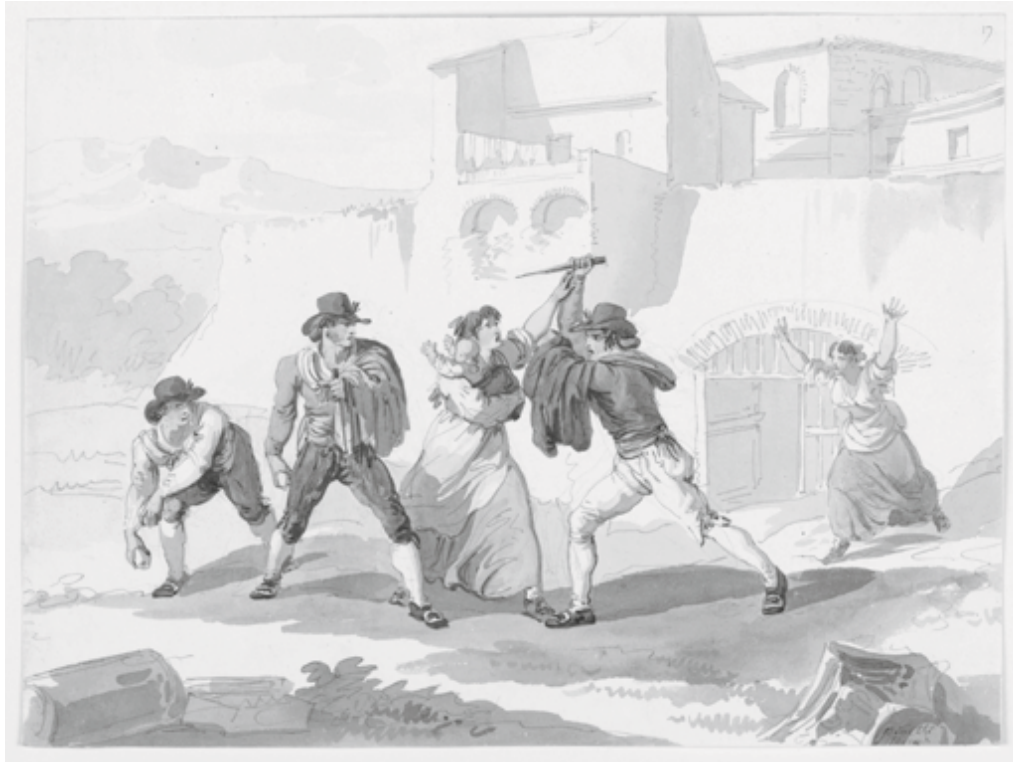
"A Domestic Dispute in Tivoli", Bartolomeo Pinelli, 1807-08

i hemmet vid något tillfälle och att ungefär fem procent gjort det ofta. Våld mot barn är en omfattande fråga med ytterligare dynamiker än övrigt relationsvåld. Av den anledningen har därför sådant våld inte tagits med i den här artikeln utan berörs bara i förbifarten. Det är dock av betydelse att ha nyss presenterade siffror i åtanke när en förhåller sig till vuxna och våld i nära relationer.