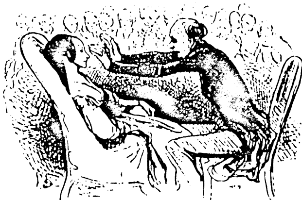
Hypnotisör i arbete. Tysken Mesmer ansåg sig kunna bota med en kraft som utgick från händerna. Etsning av Daumier.