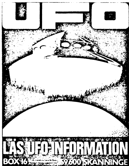
UFO - en fantasifull version.

Sätt dig i ett mörkt rum, så mörkt att du inte ens efter mörkeradaptation kan urskilja vad som finns i rummet. Placera mitt emot dig i rummet en svag ljuskälla, som ger en liten ljuspunkt men som inte är tillräckligt stark för att lysa upp rummet i övrigt. Du kommer knappt att tro att ljuspunkten verkligen står stilla. Den ger nämligen intrycket av att hela tiden röra sig. Detta är den autokinetiska effekten, och den har gett upphov till många rapporter om rörelser hos UFO .