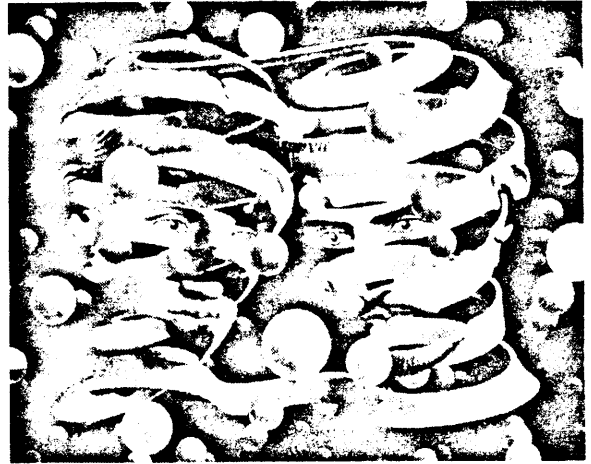
◊ LITOGRAFI av M C Escher.

"Jag har inte den minsta aning om någon har haft sexualumgänge. Jag är säker på att andevägledarna hjälpte människor med dessa problem.