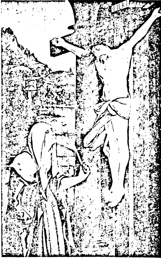
Leonhard Schaufelin, XVI c.