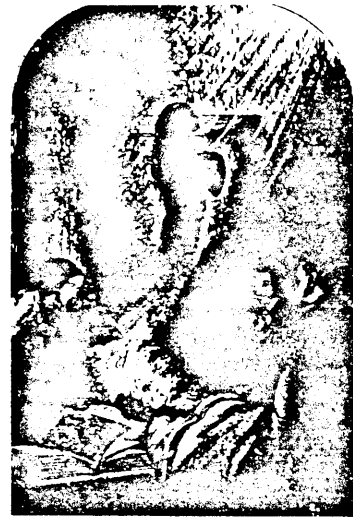
"Astralkroppen lämnar den döda". (Engelsk teckning från 1800-t.)

Det är lätt att falla för illusionen att höra vad man vill höra.