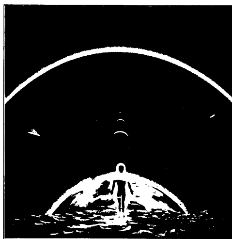
Illustrator: Richard Trägårdh.