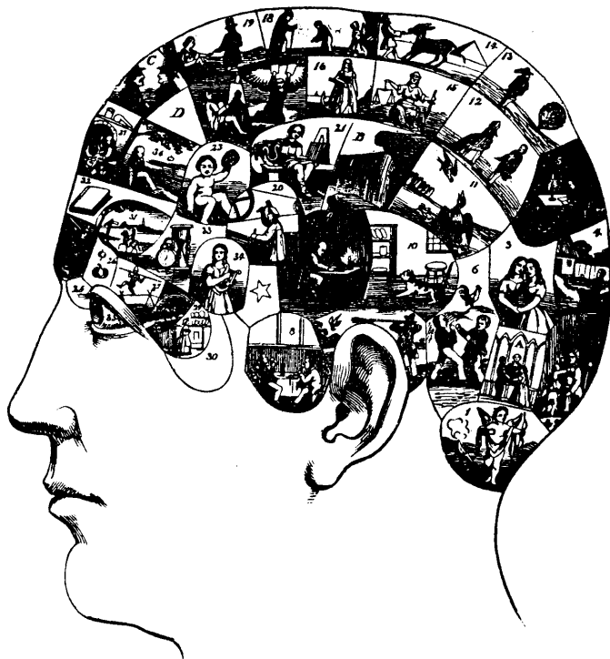
frenologi. Ur Svenska Familj-Journalen (1864): "bild, föreställande ett människohufvud indeladt i flere afdelningar, motsvarande läget av de organer eller hjerndelar, hvars yttringar betecknas af de små figurernas sysselsättningar och betydelse." Avdelningen längst ned i nacken visar centrum för könsdriften.

se" ändock påstår att de kan bedöma en människas viktigaste karaktärsdrag.