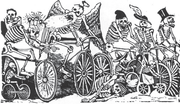
Posttraumatiskt stressyndrom?