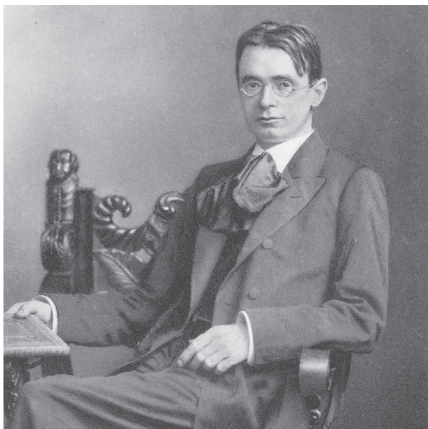
Rudolf Steiner 1904.

rekommenderande klyscha. Bara indirekt framgår att barnen i rörelsen får rätta sig efter ett tämligen strikt utvecklingschema. Ett exempel är bristen på intellektuella utmaningar, som förklaras av att intellektet inte anses vakna förrän i 14-årsåldern (då astralkroppens utvecklas). Synsättet stöds av den antroposofiska läkekonsten, som varnar för förhårdnande i förtid, associerat med materialism, till följd av tidig intellektualisering. Att "låta barnen få vara barn", för att citera en annan av bokens många floskler, blir för många en övning i att uthärda understimulansens