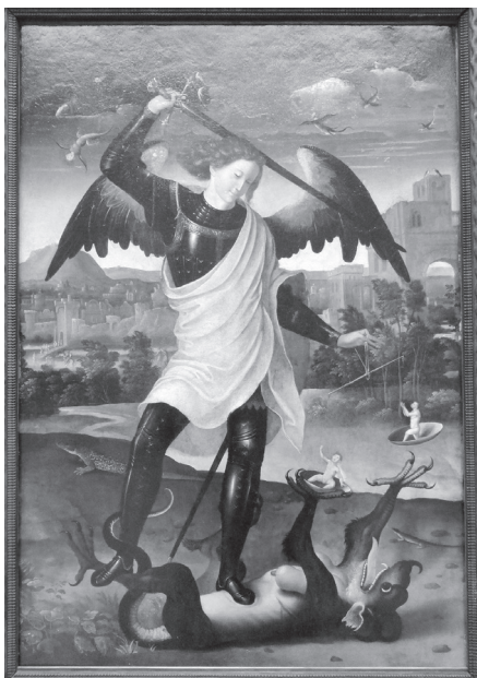
Sankt Mikael och draken. Okänd spansk konstnär.

ningen, vått-i-vått- och skiktmålningen, Parsifal, den projektiva geometrin och pentatoniska tonskalan, med mera, har i waldorfskolan. Men trots en tröttsam detaljrikedom i övrigt, tycks författarna vara ovilliga att beröra de antroposofiska motiven. Det är feigt.