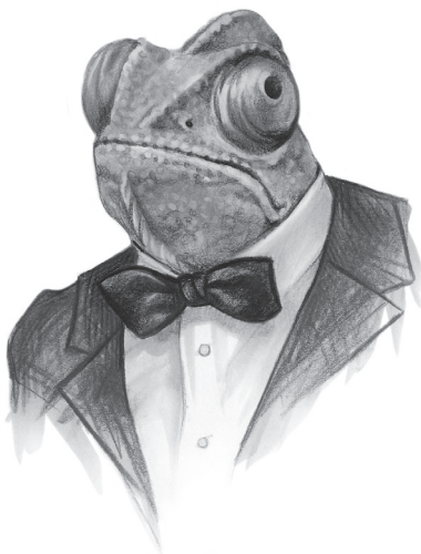
Illustration: Maria Björnbom Öberg.

ter dygnet runt. Kanalen ska heta TPV, The People's Voice , och reklam för kanalen berättar att man ska ta upp nyheter och vinklingar som ignoreras av vanliga massmedia: "Vi vill att reportrar på presskonferenser ska ställa de frågor som vanliga massmedia inte skulle drömma om att ställa – som de faktiskt skulle bli skräckslagna av att ställa."