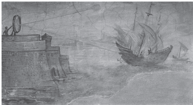
Antik dödsstråle: Archimedes spegel, Giulio Parigi 1599-1600.