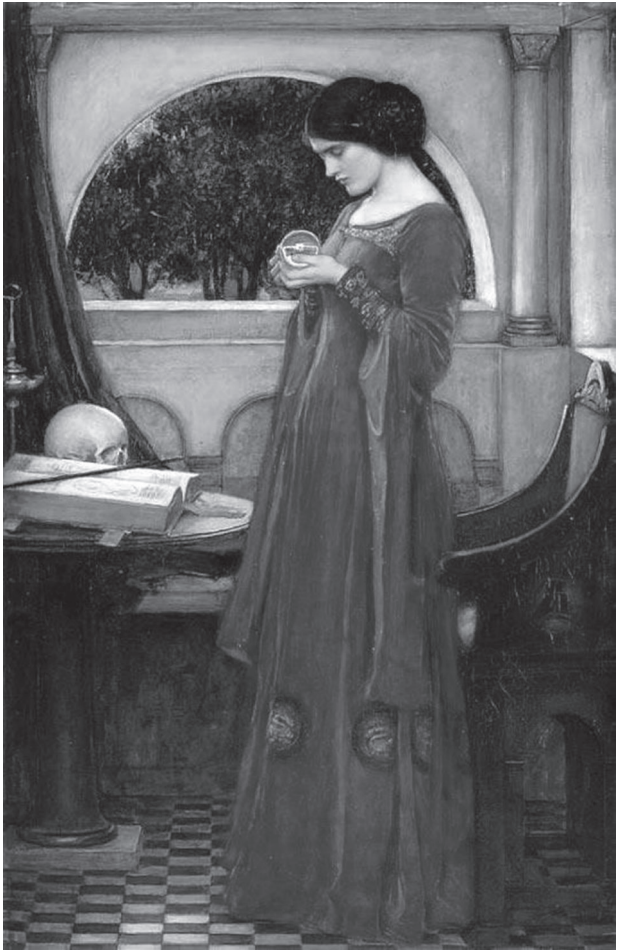
Kristallkulan, Johan William Waterhouse 1902