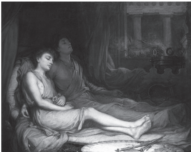
Hypnos och hans halvbror Döden, John William Waterhouse, 1874