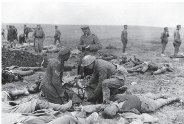
Brittiska soldater efter ett av slagen i kriget.

Det finns en stor anledning till att slaget blev så uppmärksammat. Snart skulle drabbningar i den storleken inte ens vara notismaterial; dessutom såg censuren snart till att färre och färre intressanta och aktuella uppgifter nådde allmänheten.