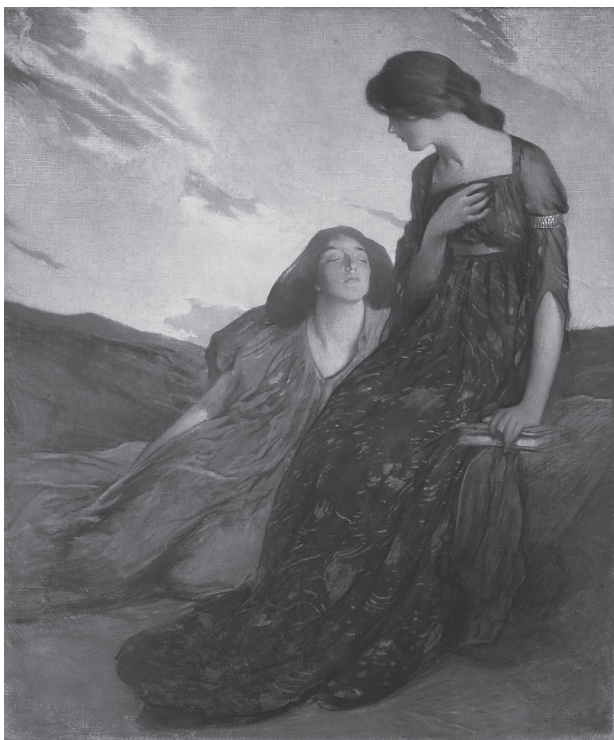
Minnen, John White Alexander 1903

Via FC framkom anklagelser om sexuella övergrepp som riktades mot fadern, modern, brodern och andra släktingar. När meddelandena kom till myndigheternas kännedom placerades barnen i fosterhem under den tid utredningen pågick.