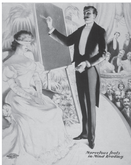
Tankeläsning, affisch från 1900

själv hur det går att skriva pekfingervals med slutna ögon.