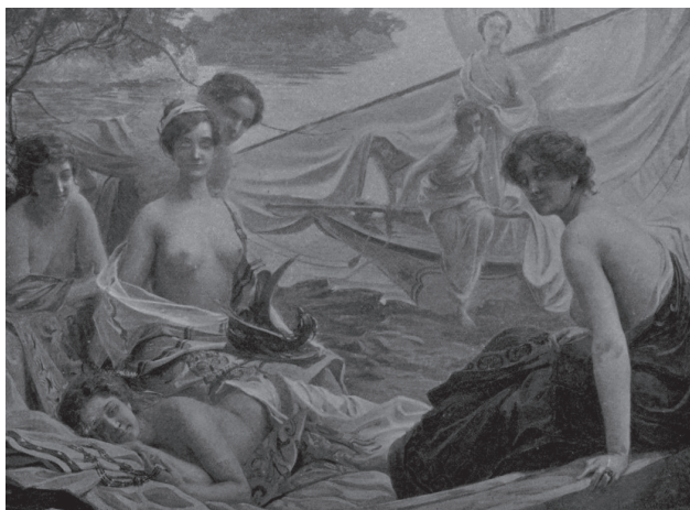
Drömsäljaren, Paul Émile Chabat 1897

Brodern anmälde skolan till Skolinspektionen, vilka vägrade ta sig an frågan. Skolan å sin sida anmälde bro-