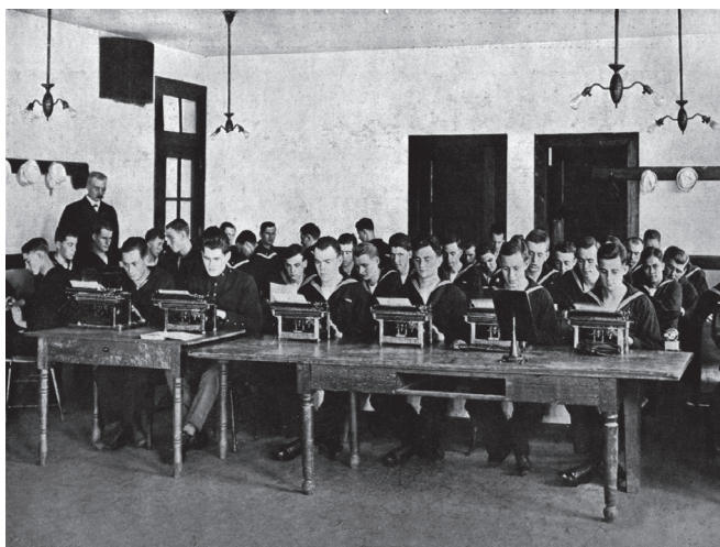
Lektion i maskinskrivning, flottan, USA 1917

Tekniken att hjälpa elevens finger hitta tangenterna