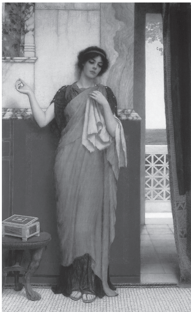
Fåfångar tankar, Johann William Goodward 1898