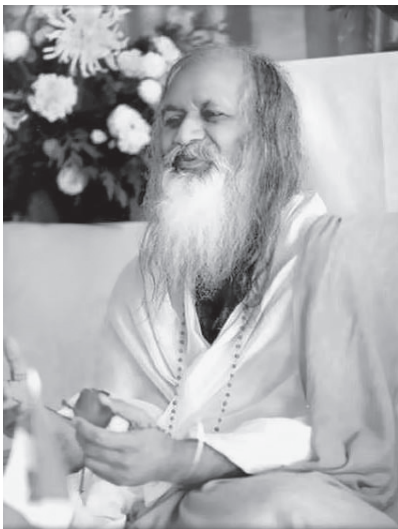
Maharishi Mahesh Yogi

Nader tog också över rollen som TM-rörelsens ledare vid Maharishis död år 2008. Sedan han blev ledare för rörelsen har texter av honom placerats under rubriken "Maharishis böcker" i rörelsens officiella publikationer. I ett vetenskapligt sammanhang krävs kritisk distans till den sortens organisationspolitiska åtgärder, men författaren visar ingen sådan kritisk distans.