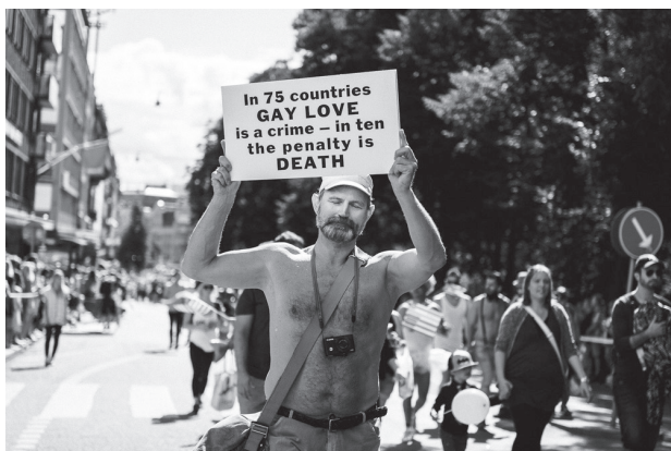
Inom priderörelsen talas det ibland om en "homonorm".

ta oavsett huruvida de har samma könstillhörighet, olika könstillhörigheter eller inga könstillhörigheter. Samtidigt som detta kan ses om jättequeer så går det också att hävda att heteronormen numera är förlegad. Att vi i stället bör hålla oss med en samtyckesnorm, och att det utifrån denna är helt normalt med BDSMF. Oavsett sådana analyser så finns det många som har BDSMF som en del av sin identitet och/eller sexuella utlevnad utan att för den skull räkna sig som queer, vilket också behöver respekteras. På motsvarande sätt kan även pansexualitet, intersexualism, asexualitet, polyamori, och mycket annat som också ofta ingår i priderörelsen räknas både som queer och inte som queer. För att förtydliga att sådana grupper skall vara inkluderade oavsett om de räknas som queer eller inte har en del börjat använda termen HBTQ+ i stället för bara