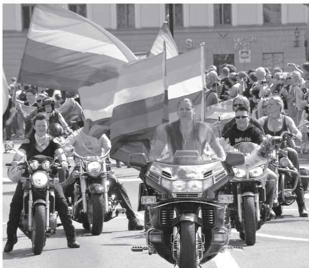
Pridefestivalen i Stockholm 2010.

tivitet öppnar för en frihet där det är upp till inblandade parter hur de vill ha sina sexliv. Därmed tränger efter hand gamla förlegade normer om att dela in sexuella handlingar i bra och dåliga utifrån en bedömning av heterosexualitet: en sexuell handling är bra när den stämmer in på en viss mall för heterosexualitet, men dålig när den inte gör det. När denna heteronormativitet växte fram trängde den i sin tur ut ännu äldre förlegade normer, till exempel om att sexualitet skulle vara något syndigt och orent. Att en norm blivit utträngd innebär dock inte att den slutat existera, utan bara att den inte längre är lika dominerande och socialt självklar som förr. Heteronormativitet kallas ibland för "heteronormen". Denna synonym fungerar, men kan