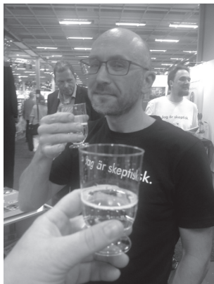
Mys i montern

dag. Besökarna bjöds på placebo för homeopatisk sömnmedicin i form av Skittles medan de fyllde i årets nyhet – en quiz med frågor relaterade till vetenskap och dagsaktuella händelser innehållande ett par riktigt luriga frågor och en och annan slamkrypare därtill. Trots enstaka muttanden om att det var för svårt så verkade de flesta