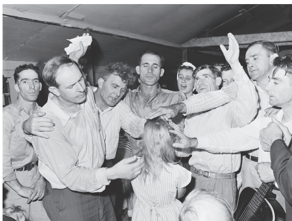
Helbrägdarörelsen sprider sig snabbt.

Utifrån rörelsens födelsestad Tulsa, Oklahoma har den förgrenat sig över hela världen. Idag är det en av världens snabbast växande religiösa rörelser, kanske den allra snabbaste.