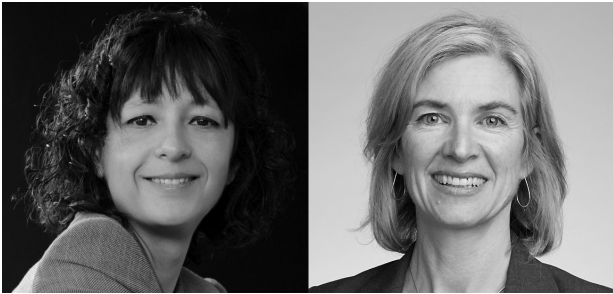
Emanuelle Charpentier (vänster) och Jennifer A. Doudna (höger), nobelpristagare i kemi.

norna hos stjärnor har de funnit att stjärnorna påverkas av ett osynligt och extremt tungt objekt.